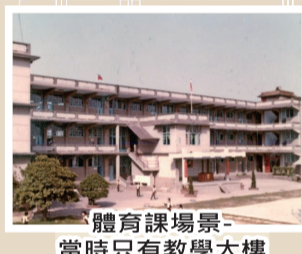
體育課場景-當時只有教學大樓