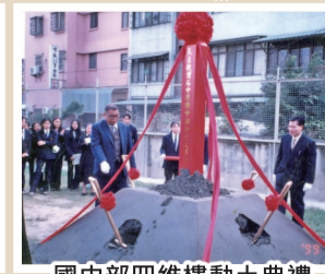
國中四維樓動土典禮