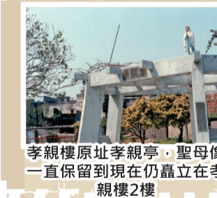
孝親樓原址孝親亭，聖母像一直保留到現在仍矗立在孝親樓2樓