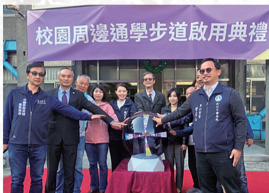
校園周邊通學步道啟用典禮

磐石中學成立於民國53年迄今已近一甲子，於設校初期即深知學生的安全是最應被重視的，因此退縮圍牆鋪設步道提供學生上下學使用，自創校以來學校持續不間斷用心維護，但因著年份久遠及各種自然因素，導致步道不堪使用，因此學校決定進行徹底整修，感謝市府挹注81萬元，加上學校自籌13萬6千元，共計94萬6千元，通學步道工程範圍為磐石中學大門兩側步道，市府補助有感，讓學生及用路人步行環境更安全。