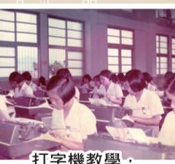
打字機教學，培育基礎人才