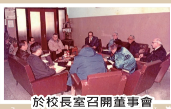
於校長室召開董事會