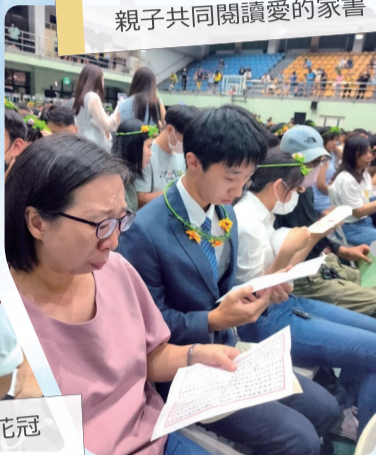
親子共同閱讀愛的家書