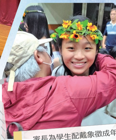
家長為學生配戴象徵成年花冠