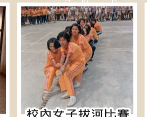
校內女子拔河比賽