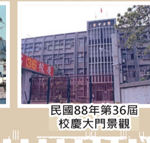
民國88年第36屆校慶大門景觀