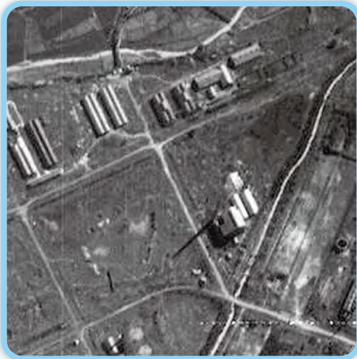
↑圖一：1946 年美軍航空照片下的六燃，高大的煙囪下拉長了影子