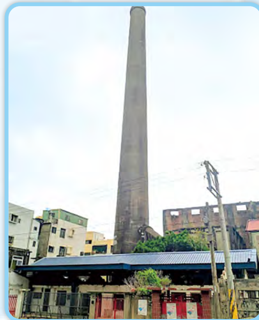
↑圖二：六燃大煙囪，留下了許多待解的謎

文史工作者所說的妥協 (Compromise)，是都市開發與古蹟保存中尋求平衡點。六燃拆與不拆，不僅考驗新竹市政府保存文化古蹟的智慧，也將決定新竹市全體市民能否擁有共同的回憶。