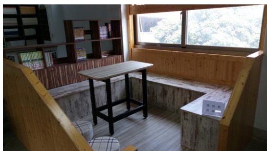
考場 4 - 圖書館二樓角落休憩區