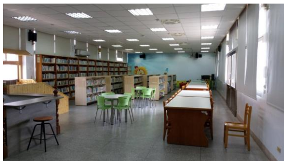
考場 2 - 圖書館二樓