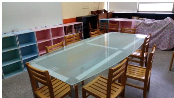
考場 1 - 圖書館二樓多功能教室