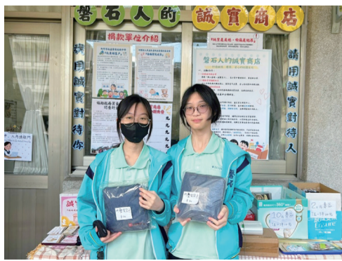
你的舊物 成為我的寶物

誠實商店的建置，不僅讓師生以實惠價格獲得所需物品，更營造出互助共好的校園氛圍，並回應天主教學校的辦學精神，將愛與希望化為具體行動。正如耶穌教導門徒所說：「你們對我這些最小弟兄中的一個所做的，就是對我做的。」期盼這個在校園一隅萌芽的愛心商店，能持續帶來正向影響，成為磐石人誠信與慈愛的見證，並以善舉開啟永續的未來，讓磐石人的誠實商店，可以永續開張！